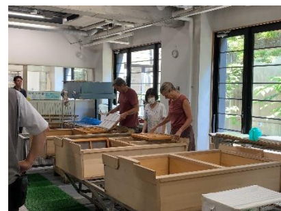
＜いの町紙の博物館の様子＞