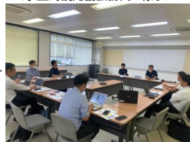
<四国の右下観光局訪問の様子>