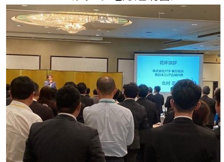
＜第3部：レセプションでの乾杯の様子＞