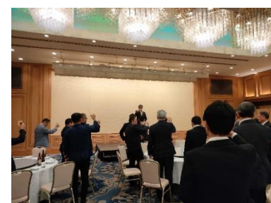
<交流会での乾杯の様子>