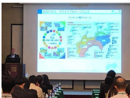
＜第1部：プレゼンの様子＞