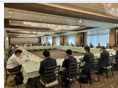
<意見交換会の様子>