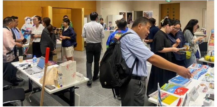
＜ティーブレイクでの意見交換の様子＞