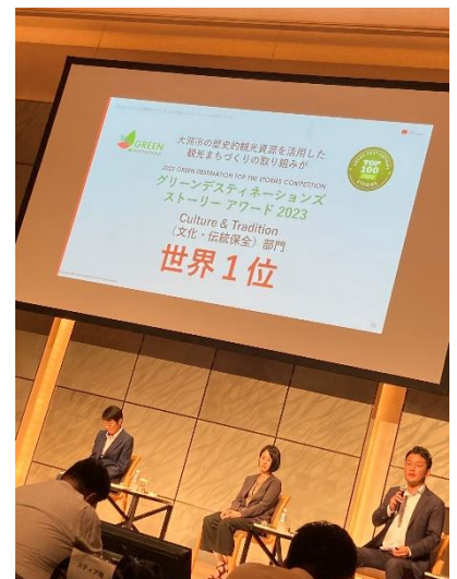
＜フォーラムの様子＞