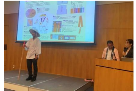
＜当機構のプレゼンの様子＞