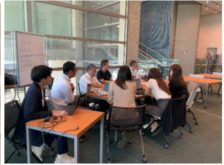
＜ディスカッションの様子＞