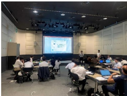
＜講師からのレクチャーの様子＞