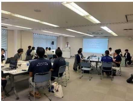
＜機構からの説明の様子＞