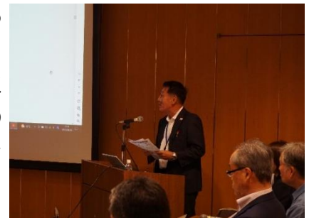
<機構からの説明の様子>