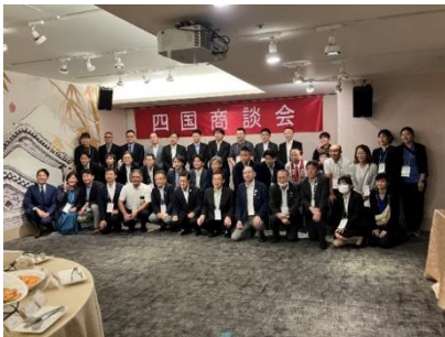
<四国商談会 参加者>