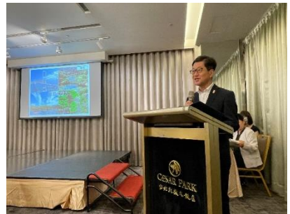
<プレゼンテーション: 濱田高知県知事>