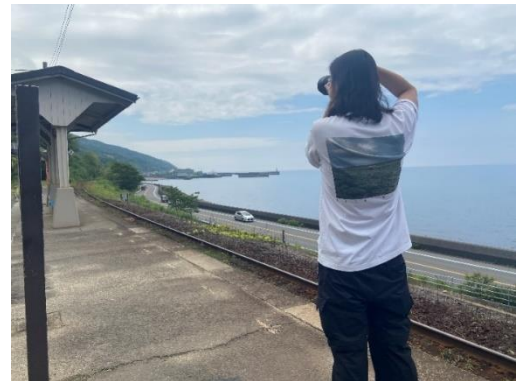
＜JR下灘駅でのロケハンの様子＞