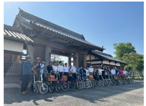
＜サイクリング体験(徳島市内)＞