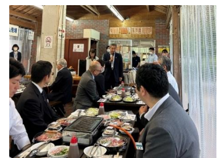
＜JR四国・半井会長挨拶(懇親会)＞