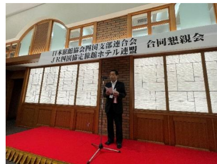
<四国旅客鉄道(株) 西牧社長挨拶>