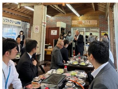
＜石川新居浜市長挨拶(懇親会)＞