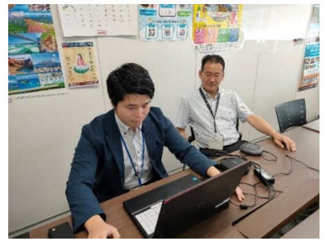
＜機構からの参加の様子＞